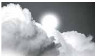
Promieniowanie UV i kwaśne deszcze