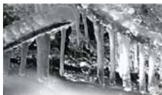
Upał i mrozy