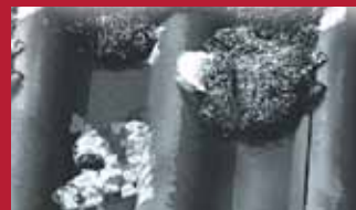
Głony, mchy i porosty